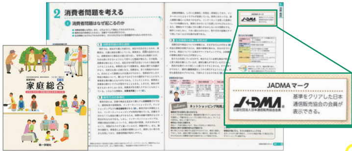
▲ 第一学習社「高等学校 新版家庭総合 ともに生きる・持続可能な未来をつくる」(令和4年発行)